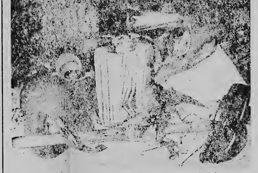
Aki nos ta mira lora e resta di e MG color berde A-652, cual Diabierne anochi pa 11'or y cuarto riba caminda di Savaneta a dal cu A-6879, posibel door cu e MG tabata mucho velocidad y otro na duna preferencia. Ta un milagro cu nada serio a pasa a hendenan.

di servicio aki, por apela directament na congreso.